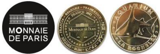
Articles de rangement pour Monnaie de Paris www.dupontphilatelie.com

Det er den rigtige betegnelse for et nyere og fremadstormende samlerområde. Det er startet i Frankrig – deraf navnet – og ved at brede sig til det meste af Europa. Jeg kalder den en Turist medalje. Det hele tog fart i 1996. Der ud gi-