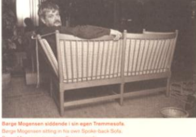
Børge Mogensen sidende i sin egen Træmestel. Børge Mogensen sidende i sit nye Træstole fra 1930. Børge Mogensen i sammen Spisestue.

More than 10,000 different pieces of furniture were designed by Danish architects during the twentieth century. By far the majority of these designs were produced between 1930 and 1970, a period often described as the golden age of Danish furniture design. Today, much of the furniture is world-famous. Many of the most sought-after pieces continue to be manufactured, and in recent years in particular there has been an explosion of interest in Danish-designed furniture, largely fuelled by the retro trend which has rekindled the popularity of and respect for the furniture of the 1930s. Auctioneers have also noticed the growing level of interest in high-quality Danish furniture making.