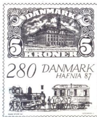
HAFNIA 87 blok IV

Udstillingen er åbent i tidsrummet 16. til 25. oktober.