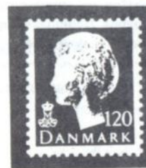
Mærket fra 1974, tv., er svært at skelne fra 1981-mærket.