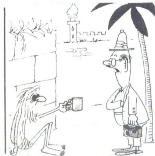
- Modtager De rejsechecka....?

Grønlands Postvæsen meddeler, at man har fået forevist et antal frimærker, som er annulleret med et stempel, der ikke anvendes postalt. Stemplingen er formentlig sket med 2 uafhængige stempler med forskellige størrelser. De har omtrent rigtig stempelstørrelse, men er uden bynavn. Man har indtil nu kun fundet små værdier af grønlandske frimærker med disse afstemplinger, og mærker uden særlig værdi, så forfalskningerne er ikke sket for at gøre billige mærker dyre, og derfor forstår man endnu mindre årsagen til denne forfalskning, men pas alligevel på, hvis du får tilbudt stemplede grønlandske frimærker med dette stempel.